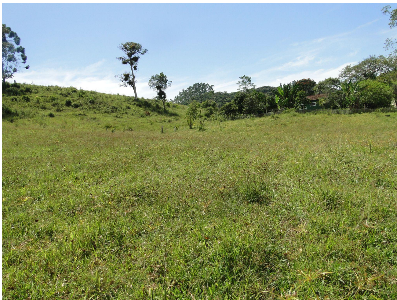
Foto 01: Propriedade atual (coord: lat.-23.508046°; lon.-45.385799°).