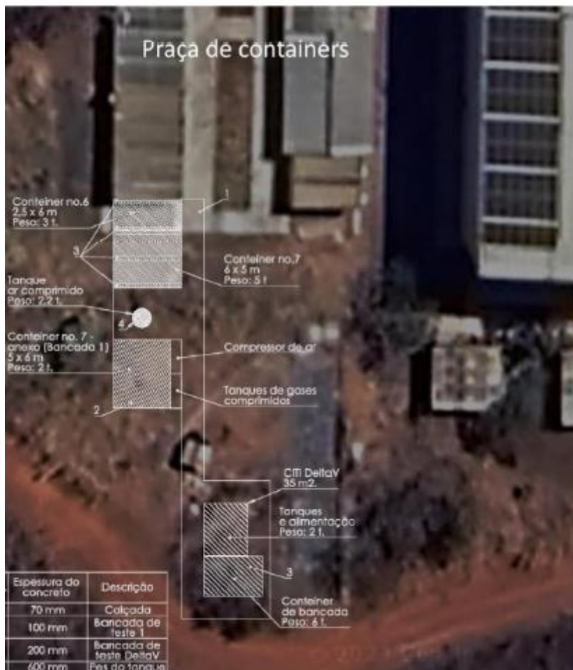
Figura 2 – a) vista área da área que receberá a infraestrutura do centro