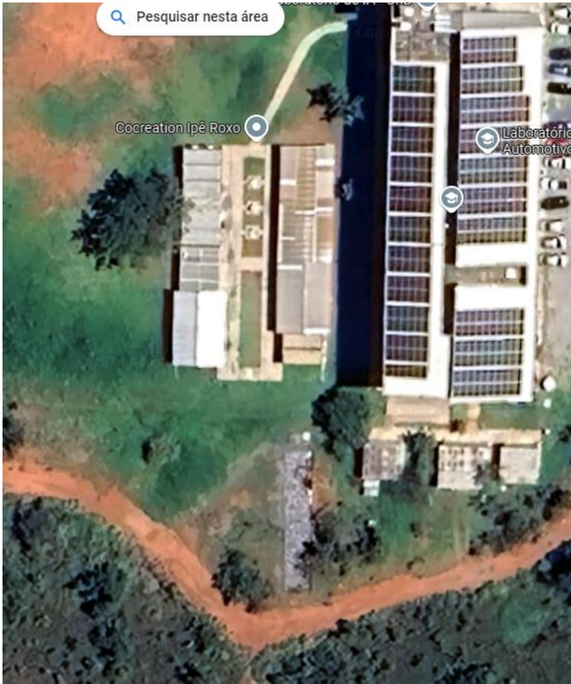
Figura 2 – a) vista área da área que receberá a infraestrutura do centro

A área a ser aterrada para adequação necessária corresponde a figura 1